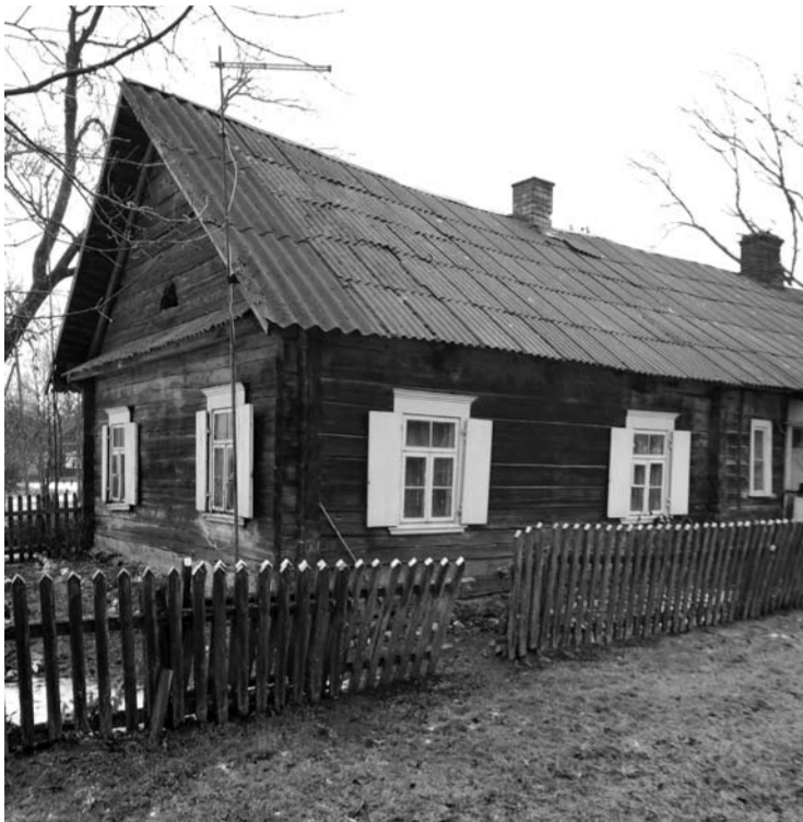
Radžiūnuose (Taujėnų sen., Ukmergės raj.) išlikęs Pukų namas, kuriame slapstėsi būsiami partizanai.