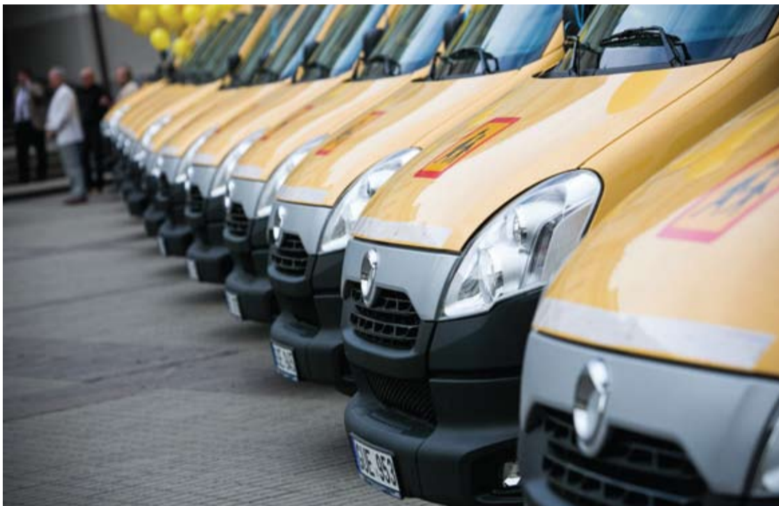
Elektriniai mokykliniai autobusiukai pirkti už europinius pinigus. Anykščių rajono savivaldybės prisidėjimas – 15 procentų.

Kiek mažiau nei po metų Anykščių rajono mokiniai į ugdymo įstaigas bus vežami elektriniais mokykliniais autobusiukais – jų rajono savivaldybė nupirko penkis ir pirks dar vieną papildomai su keltuvu. Penki tokie autobusai kainavo 949 tūkst. 850 Eur, jie buvo nupirkti iš Vilniuje esančios UAB transporto firmos „Transmitto“.