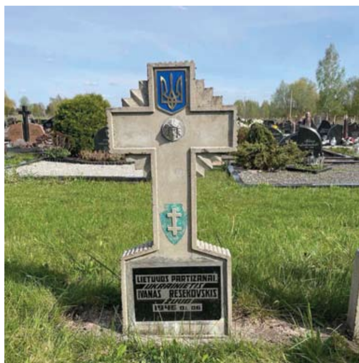
Gegužės 17-ąją Troškūnuose bus pašventintas Lietuvos partizanui, ukrainiečiui Ivanui Resekovskiui skirtas paminklas.

Troškūnų miesto kapinėse pastatytas paminklas, skirtas Lietuvos partizanui, ukrainiečiui Ivanui Resekovskiui.