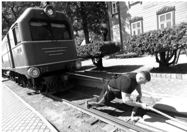
Lietuvos ir pasaulio stipruolis Žydrūnas Savickas išbandė naują rungtį – 32 tonų lokomotyvo traukimą.

Ž. Savickas yra tituluojamas stipriausiu pasaulio žmogumi: